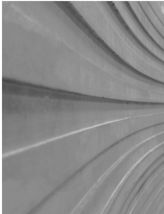
Foto von Beispielanwendung: Konkaver Sichtbeton mit Struktur, hergestellt in Schalungsmatrize mit Trennmittel WABICON HP.