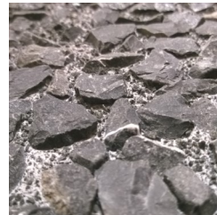
Sehr tief gewaschen. Auswaschtiefe ca. 6 mm

In unserer Bildergalerie finden Sie Varianten von gewaschenen Oberflächen.