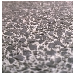
Mitteltief gewaschen. Auswaschtiefe ca. 2,5 mm