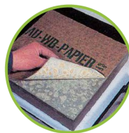
Am nächsten Tag: Beton entschalen, Papier abziehen