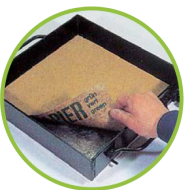
Waschbetonpapier in Schalung einlegen (bedruckte Seite nach unten)