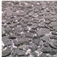
Tief gewaschen. Auswaschtiefe ca. 4 mm