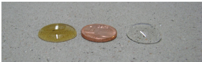
Links: geschützt mit COLORTEC® Max , links Öl, rechts Wasser

Videos mit Abperleffekten auf COLORTEC® finden Sie in unserer Videogalerie .