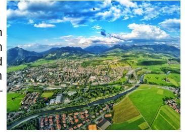
Fotos von www.sunthof.de (Sunthof ist die Oberallgäuer Mundart-Bezeichnung von Sonthofen)

stellt haben. Und wer von Ihnen im Allgäu Urlaub macht, bitte daran denken, dass es die HEBAU und Sonthofen gibt und Sie herzlich eingeladen sind uns und z.B. unseren Showroom zu besuchen.