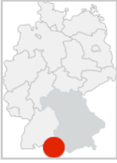
Sonthofen liegt im Oberallgäu, in bayerisch Schwaben.